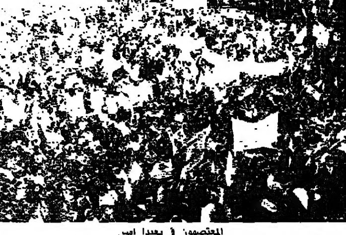
المعتصون في بعثها امس

هو الاساس لاعادة بناء المجتمع الصالح. يوم السبت هو موعد الرهائن الموجودين في سجون سوريا مع الرهائن اللبنانيين المخطوفين من طرابلس ويعليك وصور وصيدا وبيروت ومن كل لبنان.